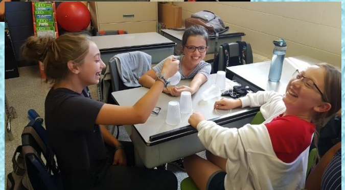
Les élèves du groupe 603 lors d'une activité scientifique.